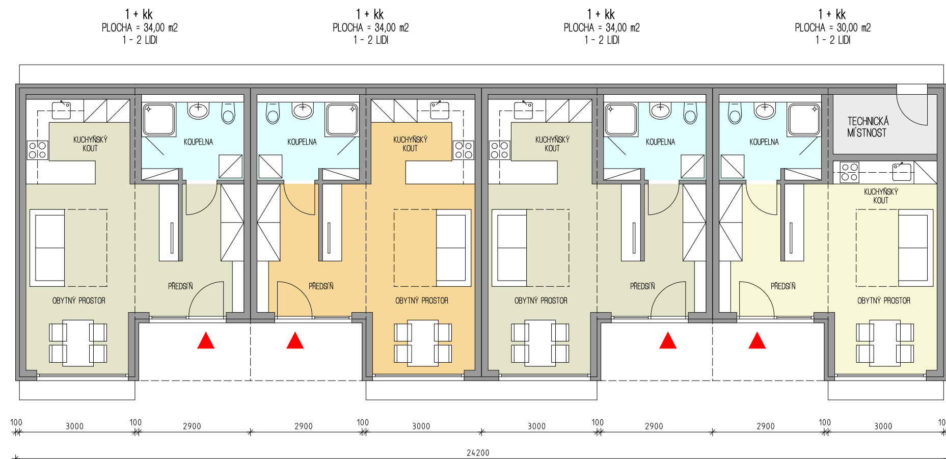
PŮDORYS 1. NP